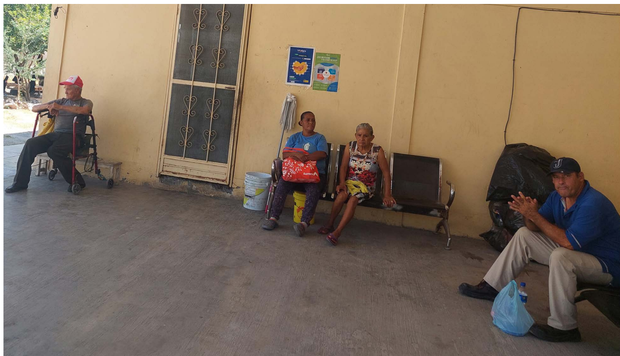
En la espera, personas mayores usuarias del comedor de los pobres. General Escobedo, Nuevo León, México. Julio 2023.

Estas condiciones son diferentes por regiones del país. Por ejemplo, en el acceso a los sistemas de salud, algunos estados como Nuevo León, contemplan el 76% de la población adulta mayor con derechohabiencia en alguna institución de salud pública, y un 40% de los que tienen más de 60 años recibe una pensión por parte de las mismas instituciones (IMSS, ISSSTE, PEMEX). En otros estados como Chiapas, menos del 5% de las personas adultas mayores cuentan con una pensión por haber trabajado de manera formal (INEGI, 2020; Calderón y Garay, 2022).