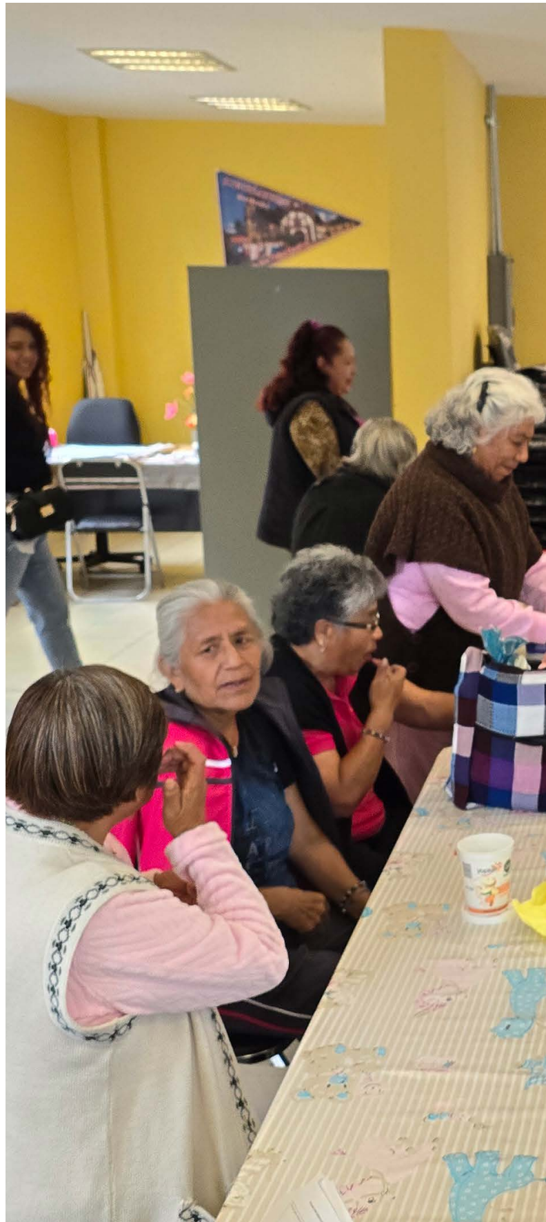
Compartiendo en grupo. Aplicación de encuestas en San Pedro Actopan, Ciudad de México, Julio 2024.

No hay ser humano que rechace recibir un dinero, sea básico, extra o de origen gubernamental, y tampoco es raro que para todos sea importante tener un ingreso económico, pero conocer lo que se siente tenerlo nos explica un efecto que va más allá de lo que materialmente se resuelve a través de él; sirve para ver lo que se valora en la etapa de la vejez. Nos permite observar que, aunque se esté mayor y ya no se trabaje, las preocupaciones no desaparecen, los ingresos constantes y seguros benefician al hogar, a la salud, a la alimentación, pero también a la salud mental. De esto se compone el bienestar de una persona mayor al menos, hasta estos momentos.