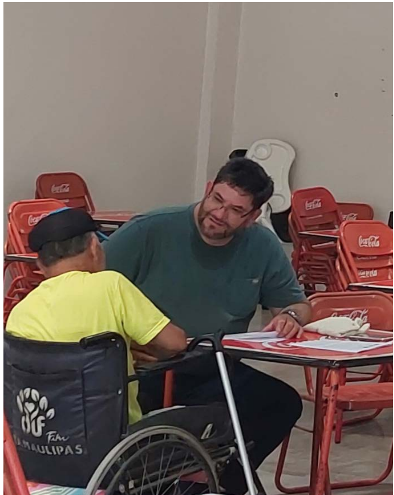
Vejez en conversación. García, Nuevo León, México. Julio 2023. Autoría: Sagrario Garay Villegas.

A demás de lo básico, encontramos que también se promueve una independencia con respecto a los miembros del hogar desde que se recibe este ingreso, ya que les permite hacer más para sí mismos. De acuerdo a los datos que recabamos, son las personas mayores las que en mayor medida pagan sus propios medicamentos o las visitas médicas en farmacias, y ya no deben pedir o esperar a que sus familiares puedan pagarlos. Una buena parte de los encuestados señaló tener diabetes (un 26% de los adultos mayores), o hipertensión arterial (el 30% de los adultos mayores) como sus principales padecimientos, es decir, enfermedades que al ser crónicas conllevan una constante revisión y por tanto, la atención a su salud no debería de esperar.