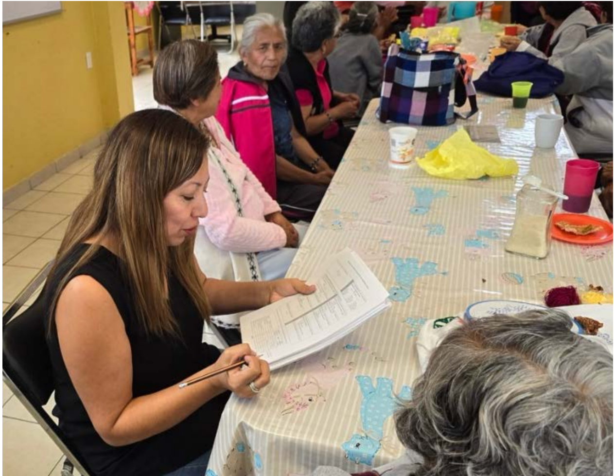
Compartiendo en grupo. Aplicación de encuestas en San Pedro Actopan, Ciudad de México, Julio 2024.