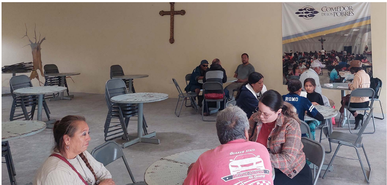
Grupo de personas mayores usuarios del comedor de los pobres en Guadalupe, Nuevo León, México. Julio 2023.

Estas preguntas y algunas otras, guiaron el interés de tres profesores universitarios para investigar sobre los efectos de esta pensión del bienestar y con ello, observar cómo se nutren nuevas ideas de la vejez y los viejos, recopilando las palabras de las personas mayores. La investigación se titula: Incidencia de la pensión universal en la pobreza, calidad de vida y bienestar de las personas adultas mayores , se inició en 2023 y tendrá su finalización en 2026. Es dirigida por la Universidad Autónoma de Nuevo León (UANL), la Universidad Iberoamericana Puebla (IBERO - Puebla) y la Universidad Autónoma de Baja California (UABC) con un investigador de cada universidad como responsable y un pequeño grupo de estudiantes de las licenciaturas de Sociología y Trabajo Social. Cuenta con el apoyo de la Secretaría de Ciencia, Humanidades, Tecnología e Innovación de México (SECIHTI) a través de la convocatoria de Ciencia de Frontera 2023, a través de la cual, se promueve el estudio e investigación de temas relevantes y con implicaciones sociales en nuestro país.