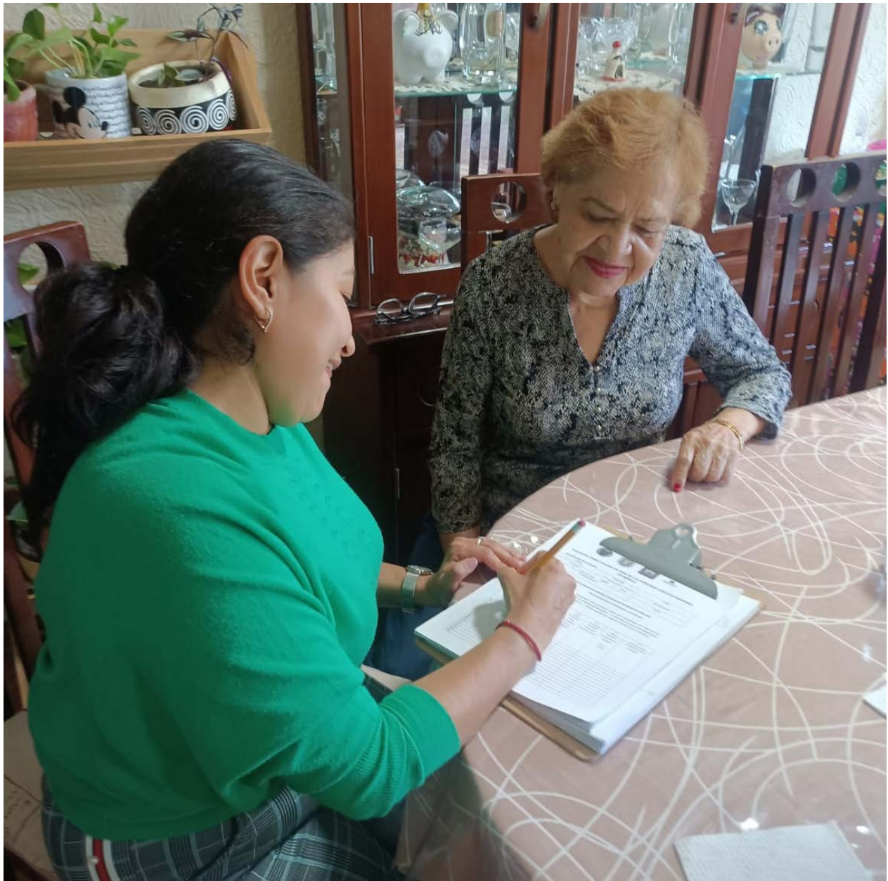
Aplicación de encuestas. Ciudad de México, México. Octubre 2023.

Los datos de esta encuesta aún se están procesando para todo el país, pero de manera preliminar hay varios resultados que son muy interesantes. Primero, como lo suponemos, muchos utilizan el ingreso de la pensión para pagar alimentos, pero encontramos que no solamente es para pagarlos, sino también para mejorar el tipo de alimentos que consumen. Por ejemplo, para algunos, les permite comprar “algo especial como carne, pescado o leche”.