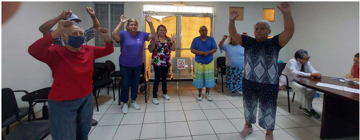
Activación física en grupo, personas mayores. Mexicali, Baja California, México. Septiembre 2023.

Hoy más que nunca en el país, la población mayor constituye un sujeto social que se observa en los barrios y en las colonias organizando las actividades comunes, en las escuelas apoyando con el cuidado de los nietos, en los partidos políticos tomando decisiones, en el ámbito laboral desarrollando actividades para la subsistencia, en parques y espacios públicos ejerciendo actividades de autocuidado y tantas cosas más que nuevamente somos capaces de ver y valorar.